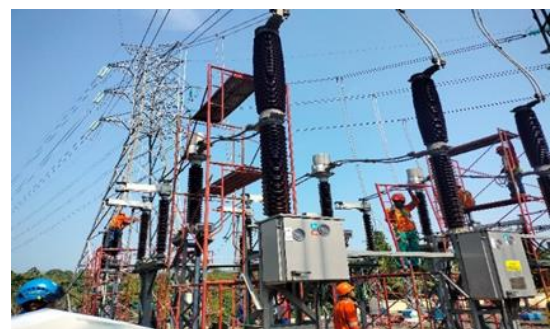
Gambar 1. Circuit Breaker

Circuit Breaker (CB) atau Pemutus Tenaga (PMT) merupakan peralatan utama dalam sistem proteksi tenaga listrik yang berfungsi untuk menghubungkan dan memutus arus listrik baik pada kondisi operasi normal maupun saat terjadi gangguan, seperti arus hubung singkat. Keandalan CB sangat menentukan kontinuitas pasokan energi listrik karena kegagalan operasi CB dapat menyebabkan kerusakan peralatan lain serta meningkatkan risiko gangguan sistem berskala luas [10], [11], [12].